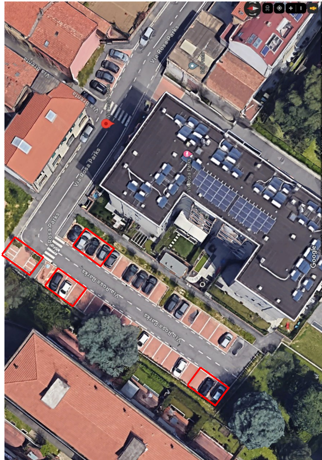
Allegato 1 – foto aerea con indicazione delle porzioni sulle quali effettuare i lavori