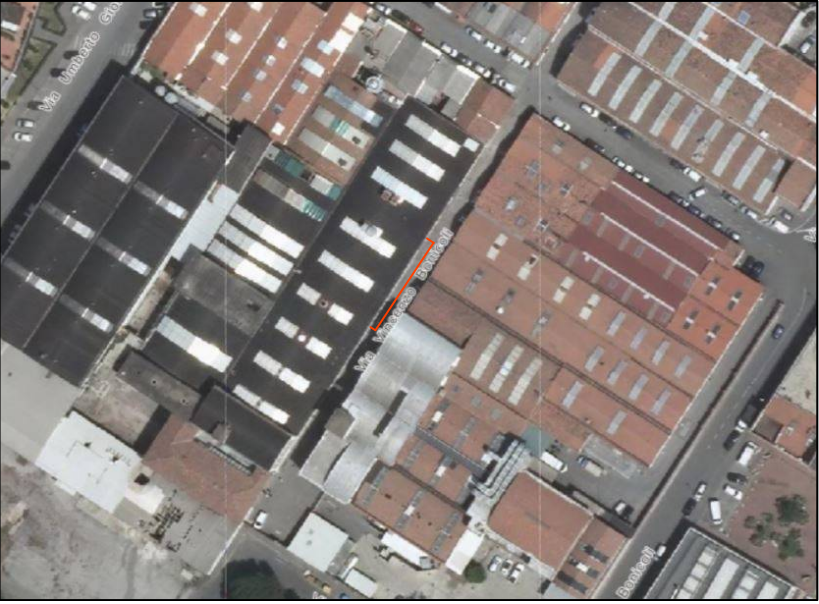
VISTA AEREA CON INDICAZIONE SOMMARIA DELLA O.S.P.