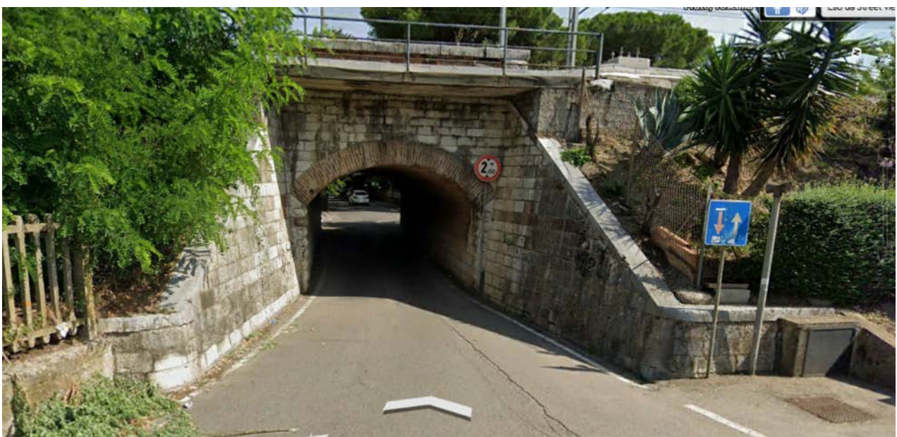
Area da occupare via Fonderia