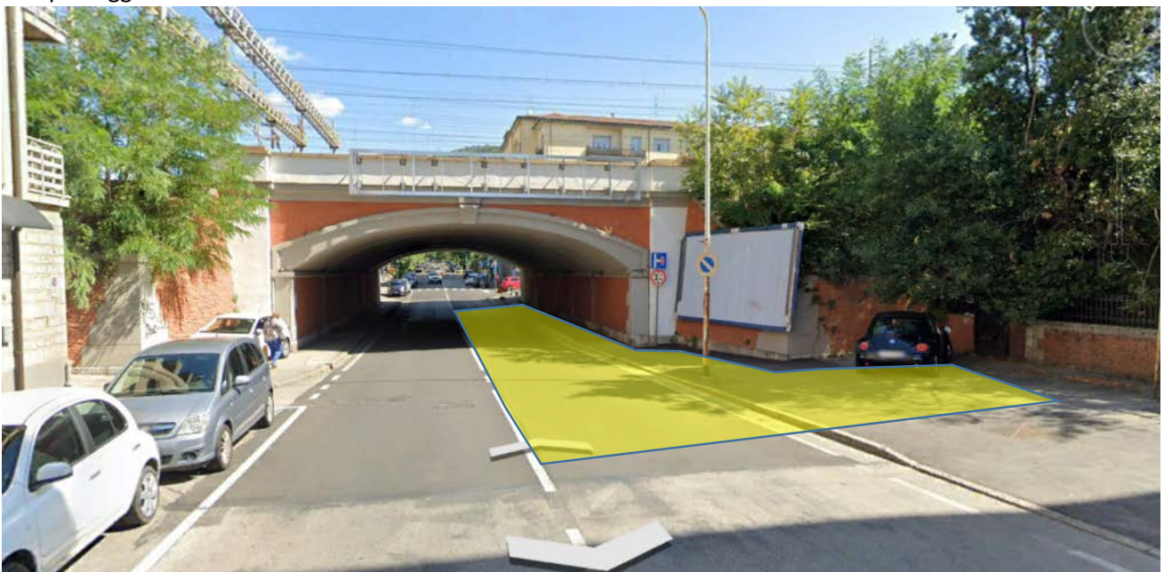
Area da occupare via Macchiavelli