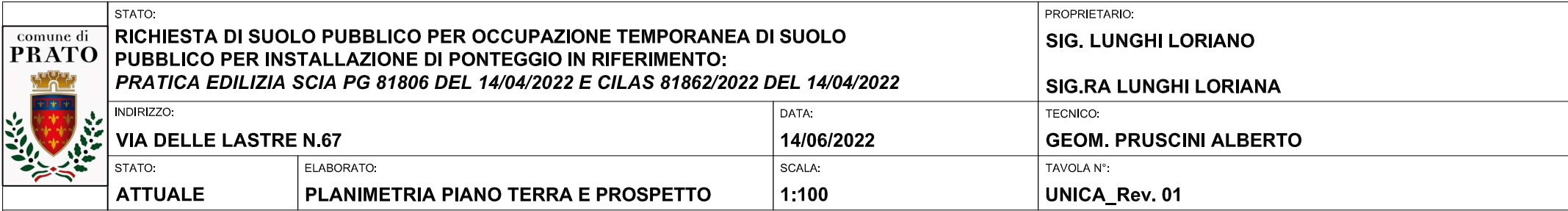
PLANIMETRIA GENERALE PIANO TERRA SCALA 1:100 "STATO ATTUALE"