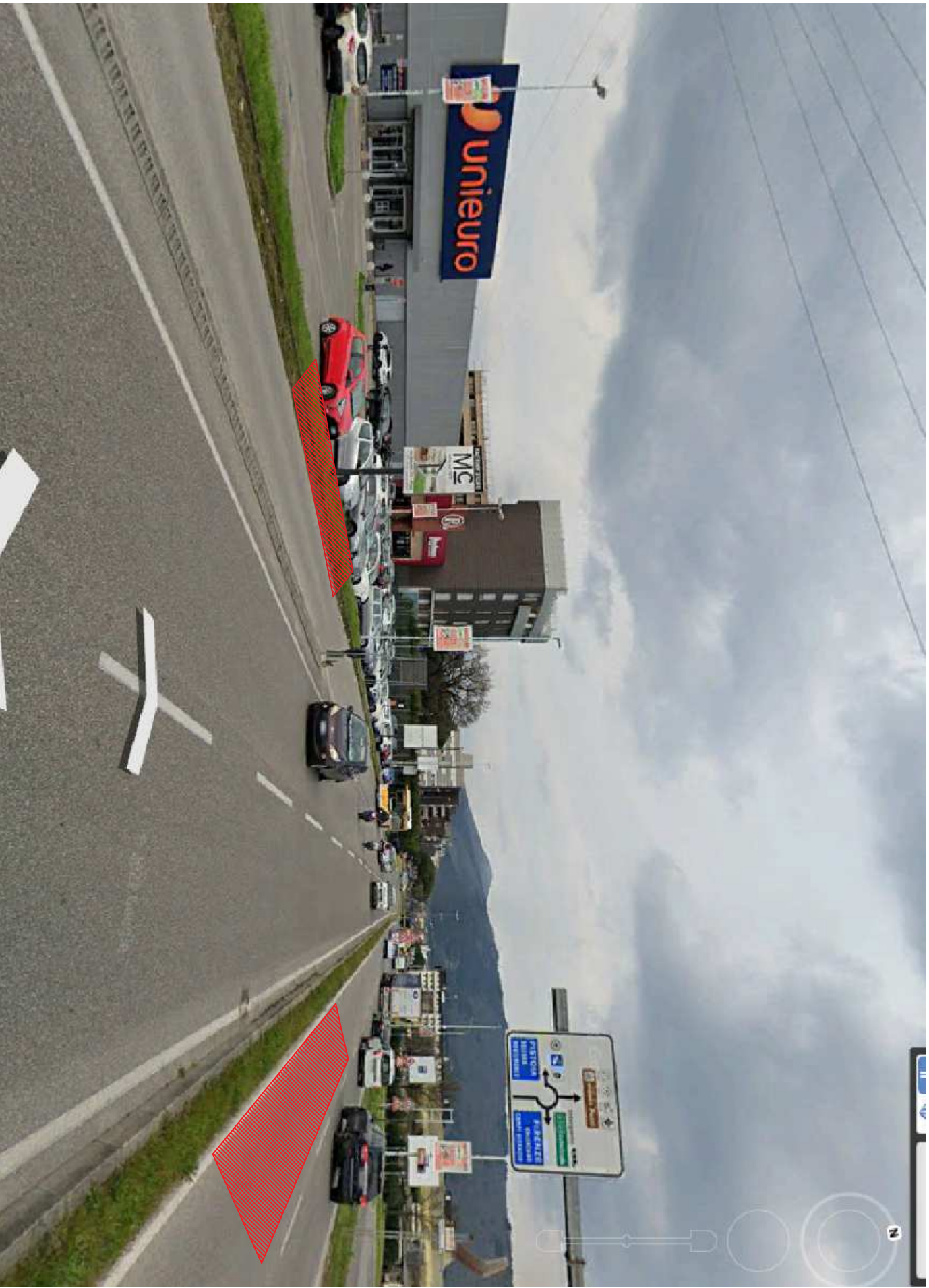
Estratto Street View