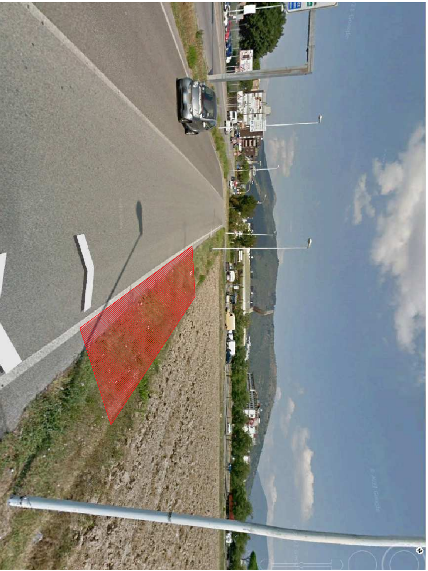
Estratto Street View