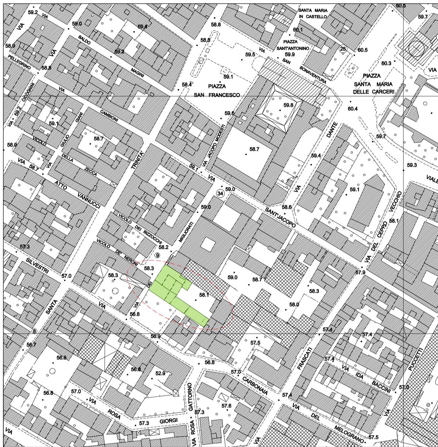
PLANIMETRIA SCALA 1:2000

Richiedente: ITALIANA APPALTI S.R.L. sede in Montevarchi (AR), Via Dante Alighieri n. civ. 14 C.F. 01892410661